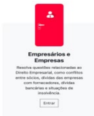
Figura 2 - Porta Empresários e Empresas.